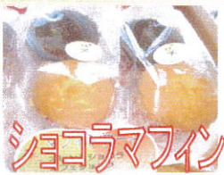
ショコラマフィン

11月にオレンジとコーヒー、2個入りのショコラマフィンケーキがデビュー！ しっとりとした味わい豊かなケーキです。 240円